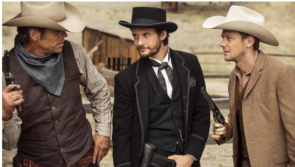
Кадр из Westworld